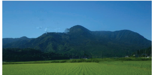
図5 提案手法による復元画像