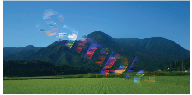
図4 従来手法による復元画像