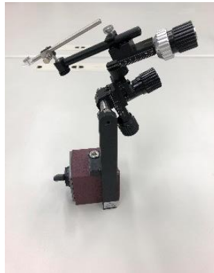
図 1. マイクロニードルとシリンジ 図 2. マニピュレーターとマグネットスタンド