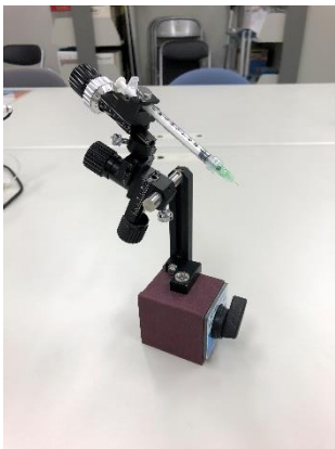
図 3. マイクロニードルを固定したマニピュレーター