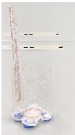
図 5. セロリの固定具

セロリの茎を色水に浸した状態でマイクロニードルの刺入実験を行うため、セロリを立たせた状態で刺入実験を行う必要がある。そこでセロリの固定具を構築した。固定具はペットボトルと割り箸を用いてホットボンドで接着した。底面にはネオジウム磁石を用いて金属製の台上に設置して実験を行えるようにした(図 5)。