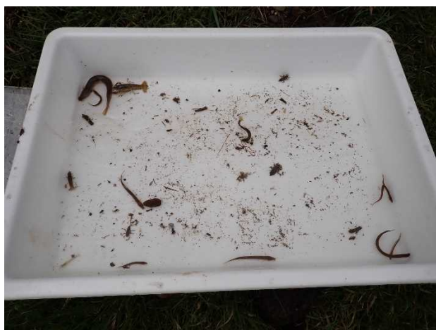
写真4 角館の生き物

(調査日：2021年3月、調査区間長 5m、川幅：角館トキ水路2.2m、美郷出川1~1.5m)