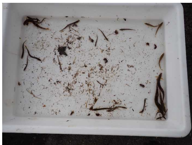
写真7 出川上流の生き物