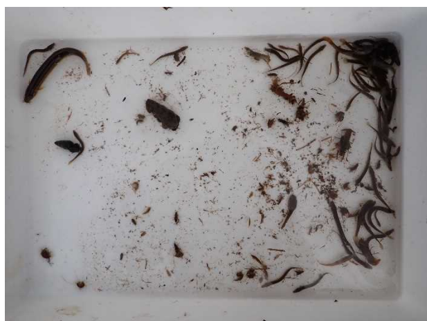
写真6 出川中流の生き物