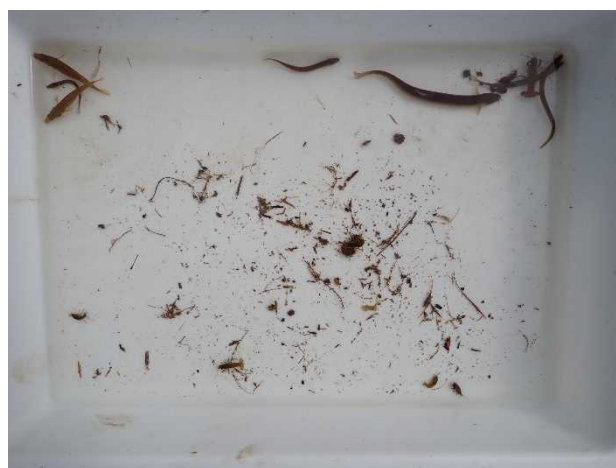
写真5 出川下流の生き物