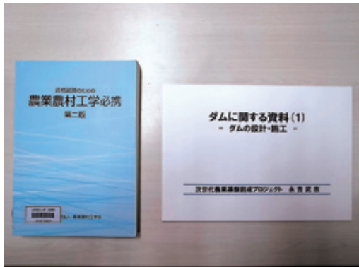
図5-2 ダムの設計・施工に関する資料。