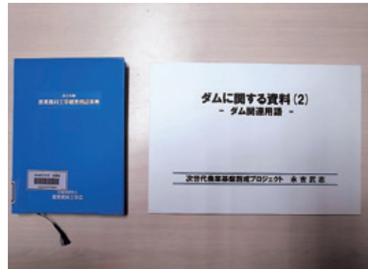
図5-3 ダム関連用語に関する資料。