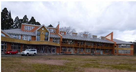
図3 BABAME BASEの外観