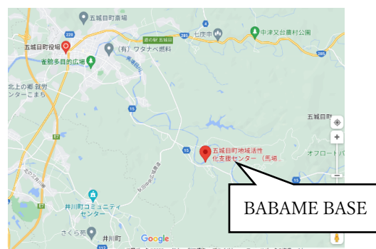
図2 BABAME BASE の位置 2)