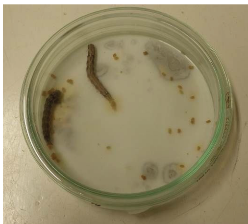
図 1 オオタバコガ幼虫のハスモンヨトウ幼虫に対する攻撃 (上：試験開始直後，下：試験開始 3 時間後)