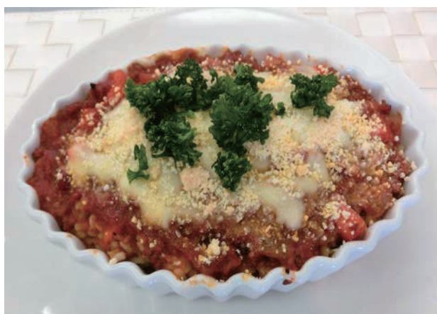
図4 ミートソースドリア.

材料：合挽き肉 400 g, 高 RS 米炊飯米 350 g, 玉ねぎ 1 個, にんじん 2/3 本, バター 40 g, ピザ用チーズ 1 袋, ホールトマト缶 2 缶, オリーブ油大さじ 1, にんにく 2 片, 赤唐辛子 3 本, 顆粒コンソメ 小さじ