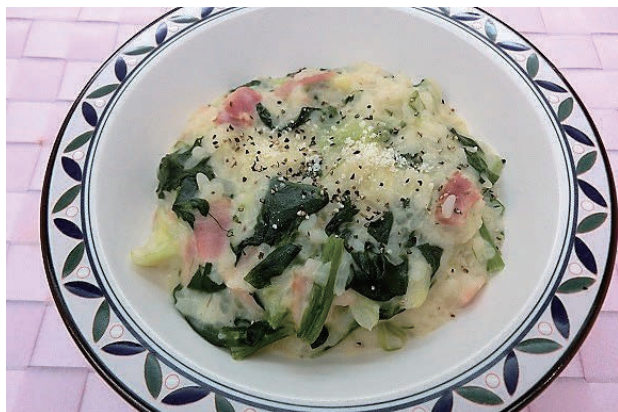
図3 キャベツとほうれん草のリゾット.

材料：豆乳 150 mL, 高 RS 米炊飯米 60 g, キャベツ 30 g, ほうれん草 30 g, ベーコン 10 g, 粉チーズ少々 作り方：鍋にごはん, キャベツ, ベーコン, 豆乳を入れた。焦げないように適度にかき混ぜながら, ご飯に豆乳を吸わせた。沸騰してきたら, ほうれん草を加えた。粉チーズを入れて, とろみがつくまで煮詰めた。