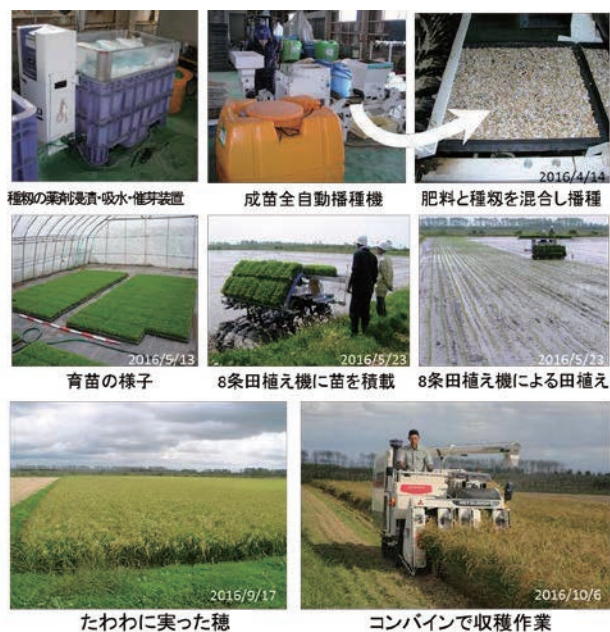
図7 2016年に本学フィールド教育研究センターで一般農家が使用する農機具で大規模栽培が可能であった。