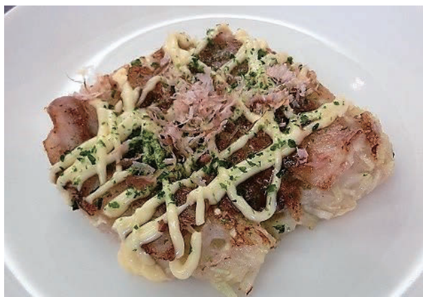
図1 米粉入りお好み焼き。

材料：山芋 170g、高RS米の米粉大さじ3、白だし大さじ1、和風粉末だし少々、キャベツ 230g、豚ばら肉 150g、鰹節少々、青のり少々、マヨネーズ大さじ1、ソース大さじ1、サラダ油大さじ1